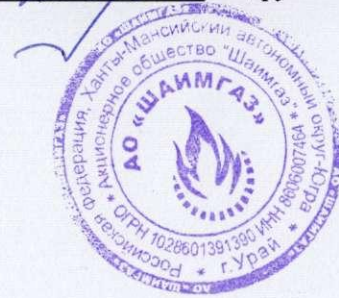
График проведения ТО сетей на 2020 год.